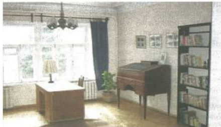
Nella foto lo studio di Boris Pasternak.

Non è da meno la dimora di Leone Tolstoj nel centro di Mosca.