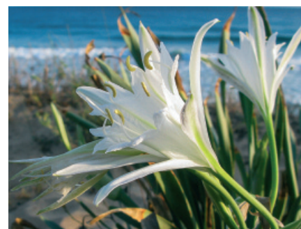
Albania: Giglio di Mare ( Pancretium maritima )