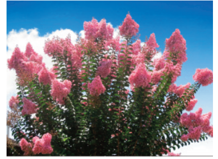
Bulgaria: Mirto Crespo ( Lagerstroemia indica )