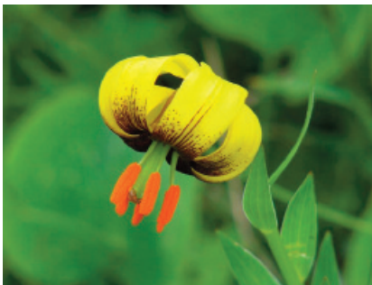
Bosnia Erzegovina: Giglio bosniaco ( Lilium bosniacum )