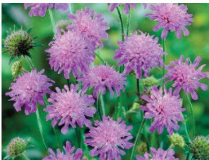
Macedonia del Nord: Ambretta ( Knautia macedonica )