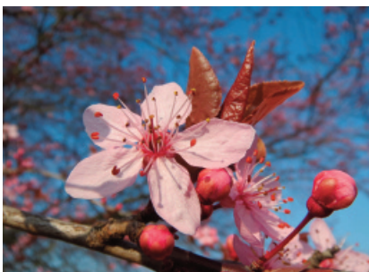
Serbia: Pruno ( Prunus domestica )