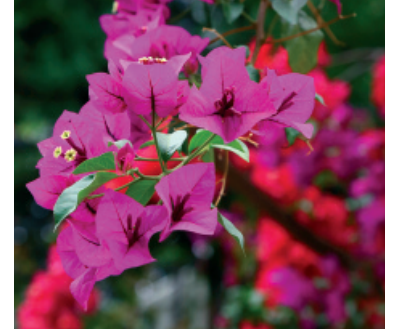
Grecia: Bouganville ( Bougainvillea spectabilis )