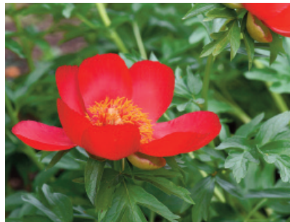
Romania: Peonia ( Paeonia peregrina )