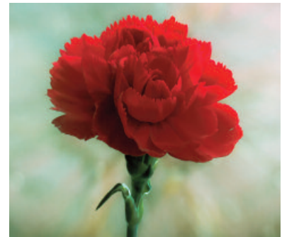
Spagna: Garofano ( Dianthus caryophyllus )