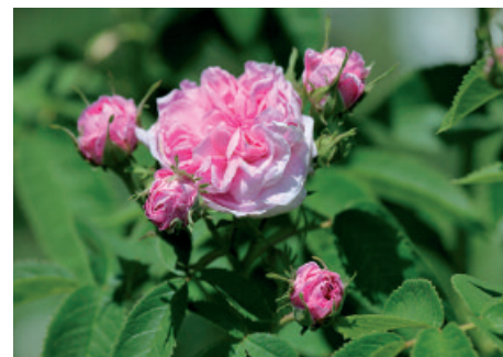
Marocco: Rosa di Damasco ( Rosa damascena )