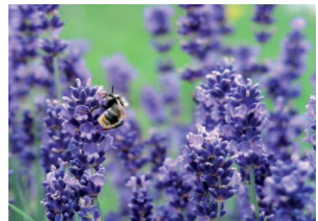
Portogallo: Lavanda ( Lavandula )