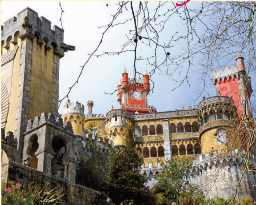
PARTENZE CONDIVISE CON ALTRI OPERATORI

Prima la prima colazione in hotel mattinata dedicata alla visita guidata della città chiamata "La Signora dell'Atlantico" per il suo aspetto elegante ed austero. Si potranno ammirare i suoi splendidi viali come l'Avenida Libertade, la piazza Rossio con la sua bella fontana e il quartiere di Barrio Alto con il suo storico Caffè Brasileira con la statua di Fernando Pessoa. La visita prosegue con la Torre di Belem, simbolo della città ed esempio importante dello stile manuelino, il monastero Dos Jeronimos realizzato su progetto dell'architetto Diego de Boitaca, la cui costruzione fu voluta da Re Manuele I per celebrare il ritorno del navigatore portoghese Vasco de Gama, dopo aver scoperto la rotta per l'India. La mattinata si concluderà con la degustazione di un tipico pasticcino locale chiamato "Pastel de Belen" a base di pasta sfoglia e uova. Nel pomeriggio proseguimento per Sintra, antico villaggio situato sul versante settentrionale della boscosa Sierra de Sintra: un tempo era la residenza estiva della famiglia reale portoghese, mentre oggi si presenta come una località pittoresca ricca di splendidi palazzi tra cui il Palacio Nacional, dichiarato Patrimonio dell'Umanità dall'UNESCO. Proseguimento per Cabo de Roca, un aspro promontorio che costituisce il punto più occidentale del continente europeo. Fino al XIV secolo si credeva che le sue scogliere brulle e sferzate dal vento fossero il confine del mondo. Rientro in hotel, cena e pernottamento.