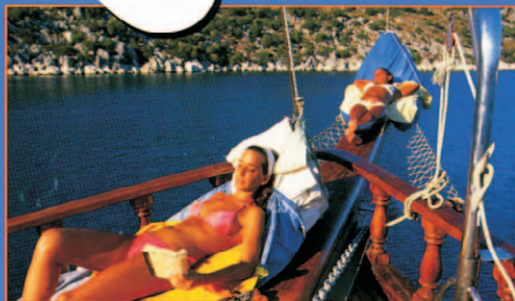
TURCHIA: lungo la costa

POSTE ITALIANE SPA - SPECIAZIONE IN A.P. - 0.3532405 (COMI) IN LEGGE 27/02/2004 N.16 ART. 1, COMMI 1, 2005 MILANO - ANNO XLIX N. 319