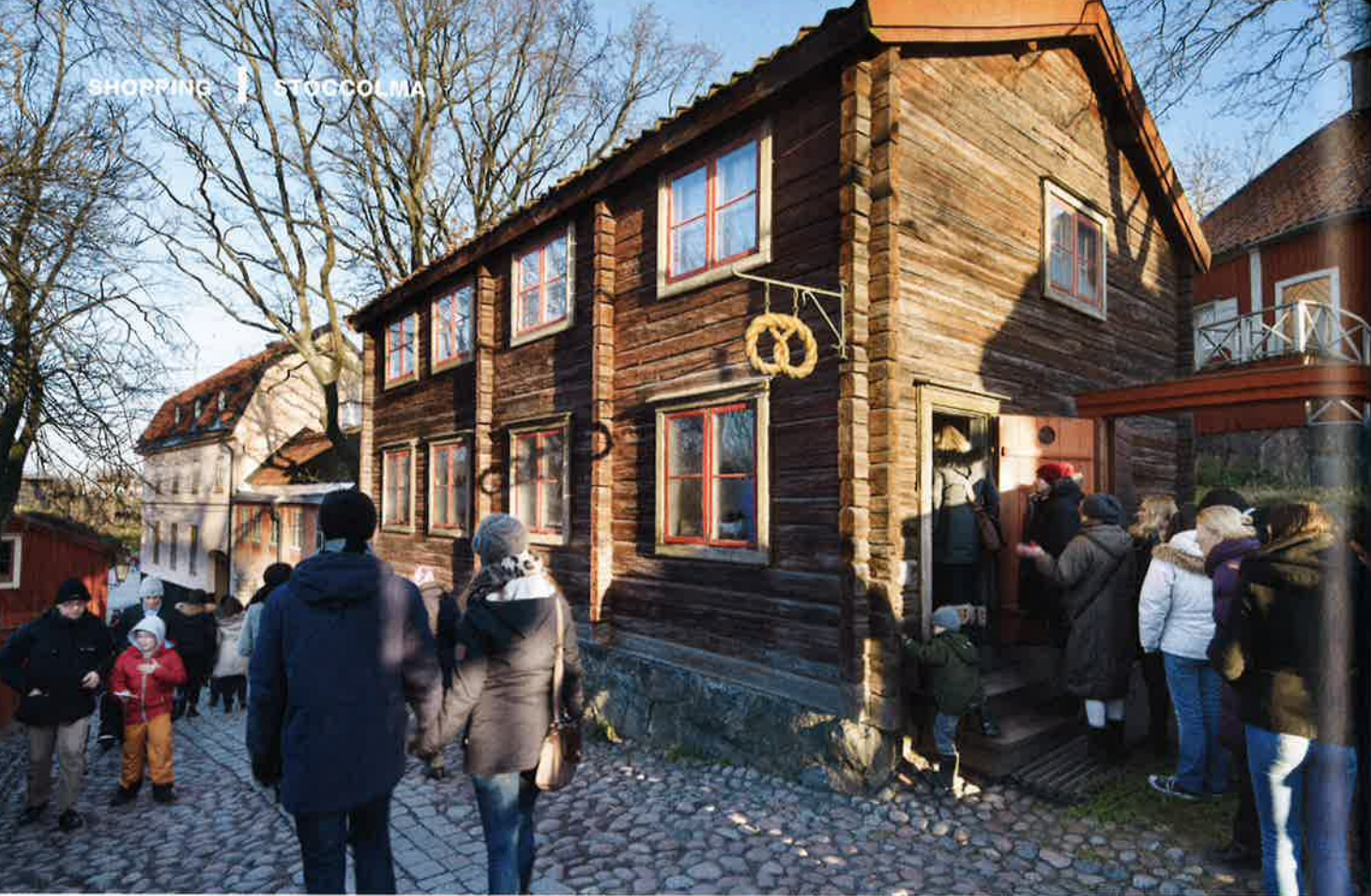
DAL 1891 LA SVEZIA DI UN TEMPO RIVIVE NEL VILLAGGIO DI SKANSEN