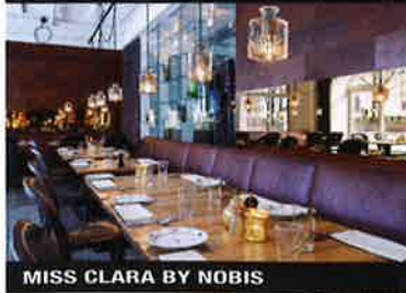
MISS CLARA BY NOBIS