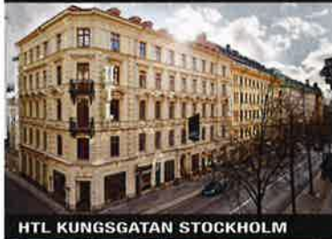
HTL KUNGSGATAN STOCKHOLM