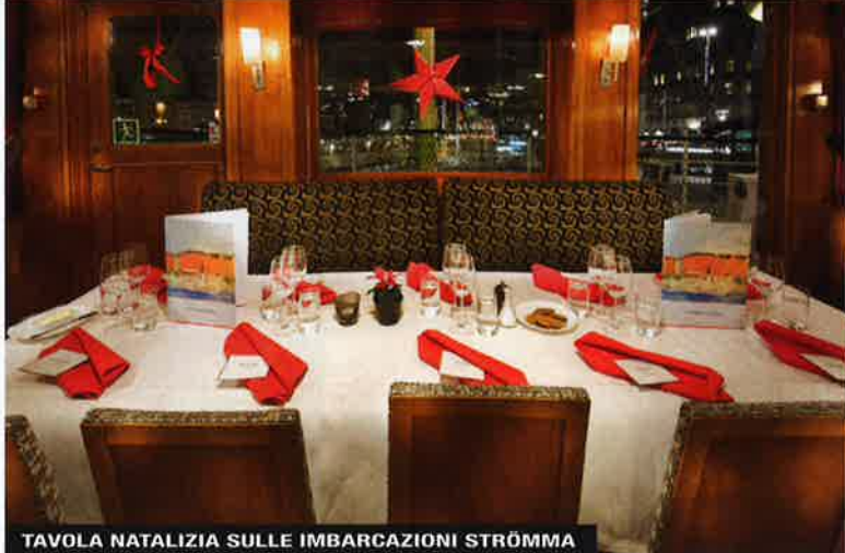
TAVOLA NATALIZIA SULLE IMBARCAZIONI STRÖMMA