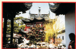
In alto, il Giardino dell'umile amministratore a Suzhou e, qui sopra, il Giardino del Mandarino Hu a Shanghai.