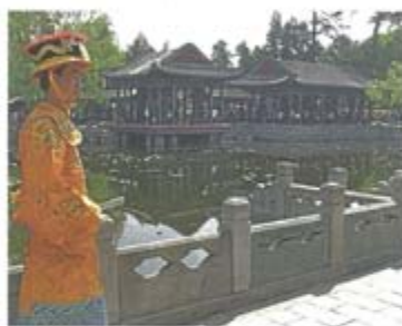
Il palazzo d'estate a Pechino, dove visse la famiglia imperiale

Il viaggio prosegue per Pechino dove si ammira il Tempio